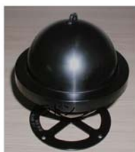
ラドン・トロン 弁別測定器 (平均ラドン濃度の測定)