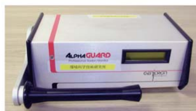
通気型電離箱 (アルファガード) (ラドン濃度のリアルタイム測定)