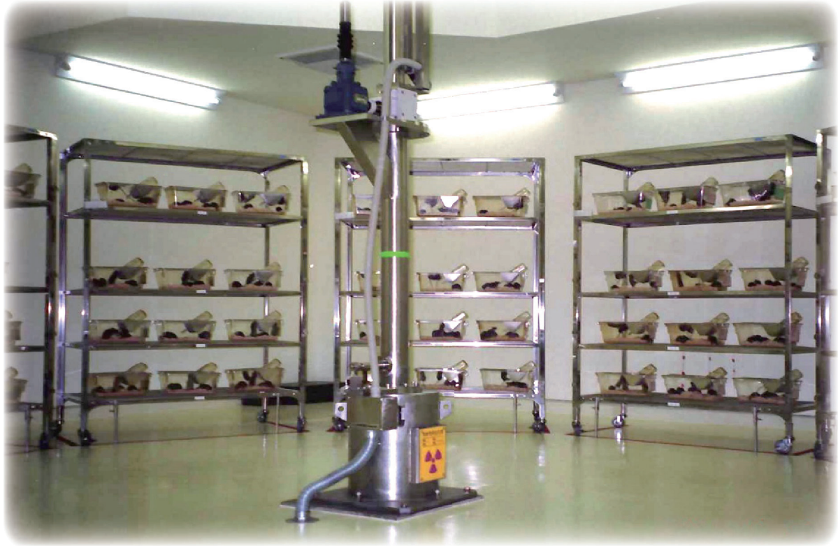
図1 放射線照射室の様子(低線量生物影響実験棟) 壁際の棚で実験動物(ネズミ)を飼育しながら、放射線をあてています。

環境科学技術研究所（以下、環境研といいます）では、みなさんが抱いている放射線に対する関心や疑問にお応えできるよう、放射性物質や放射線が人の健康や環境に与える影響に関する調査・研究を行っています。