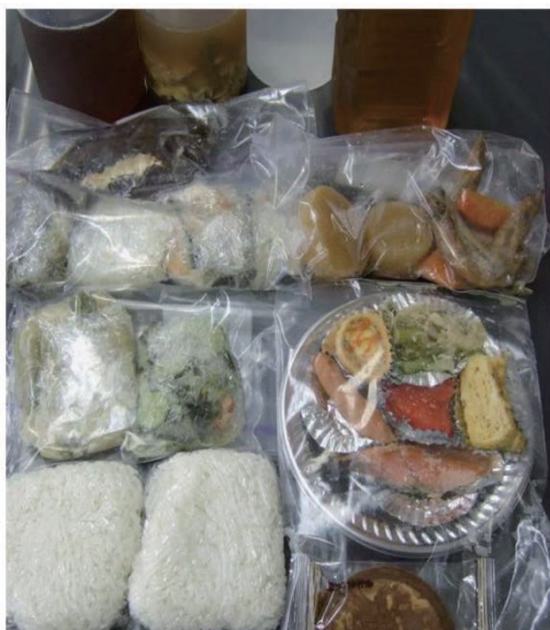
図1 指定した1日の全ての飲食物と同じものを提供していただきました(写真は1人分)